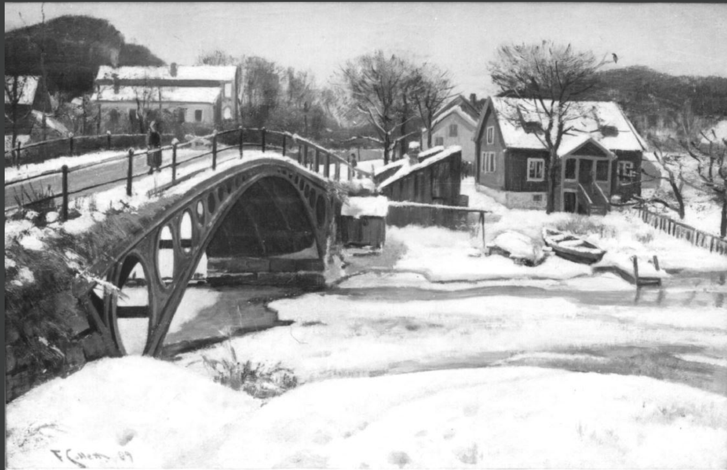
Fredrik Collett (1839-1914): Fra Sandvika. 1889