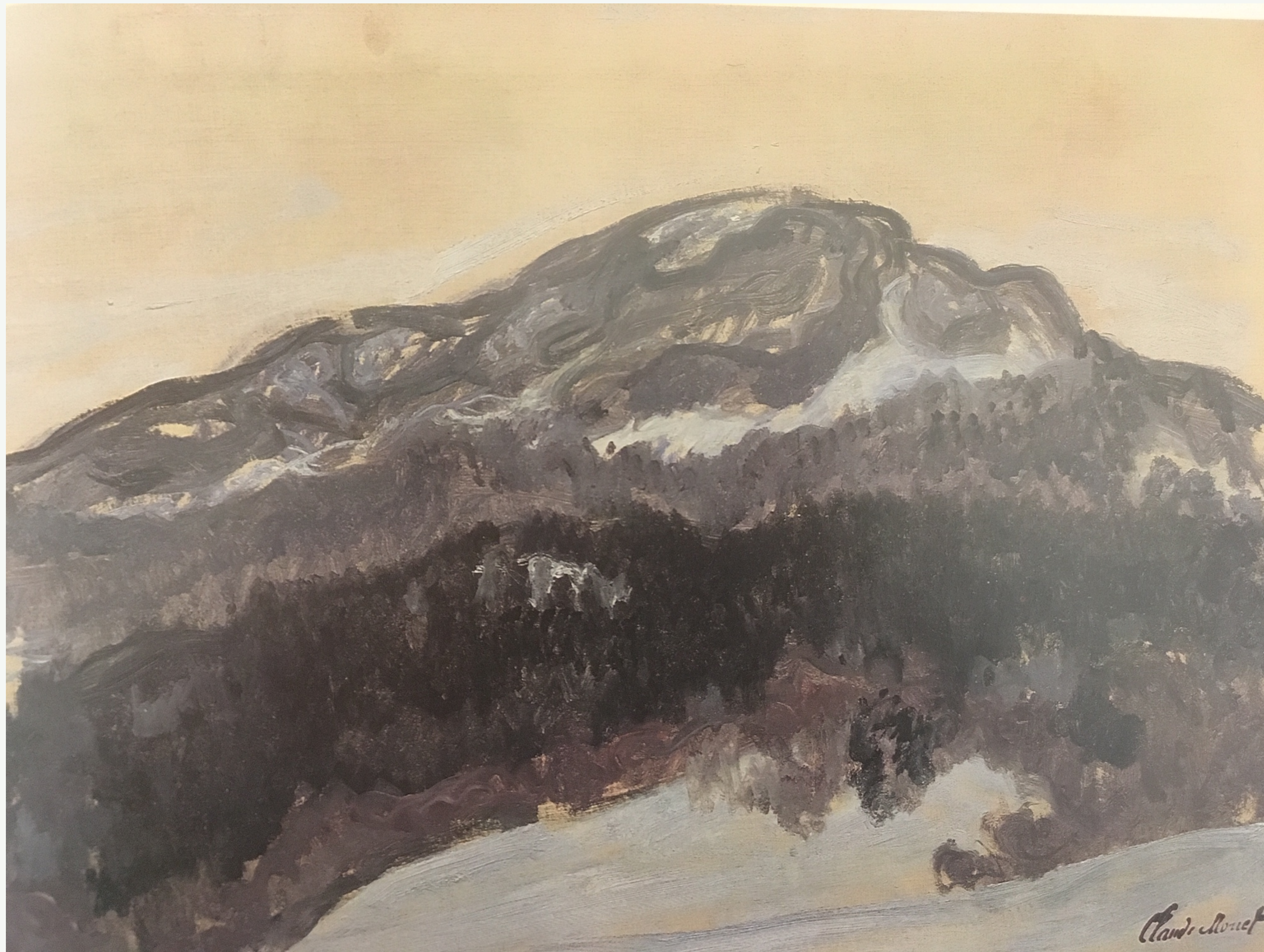
Claude Monet: Kolsås, disig vær