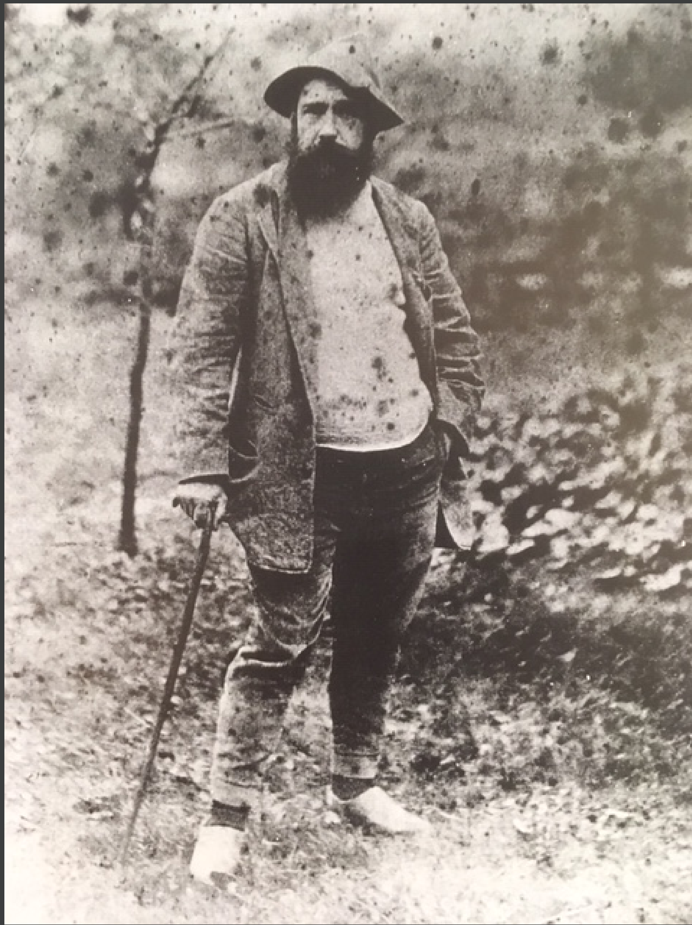
Claude Monet (1840-1926)