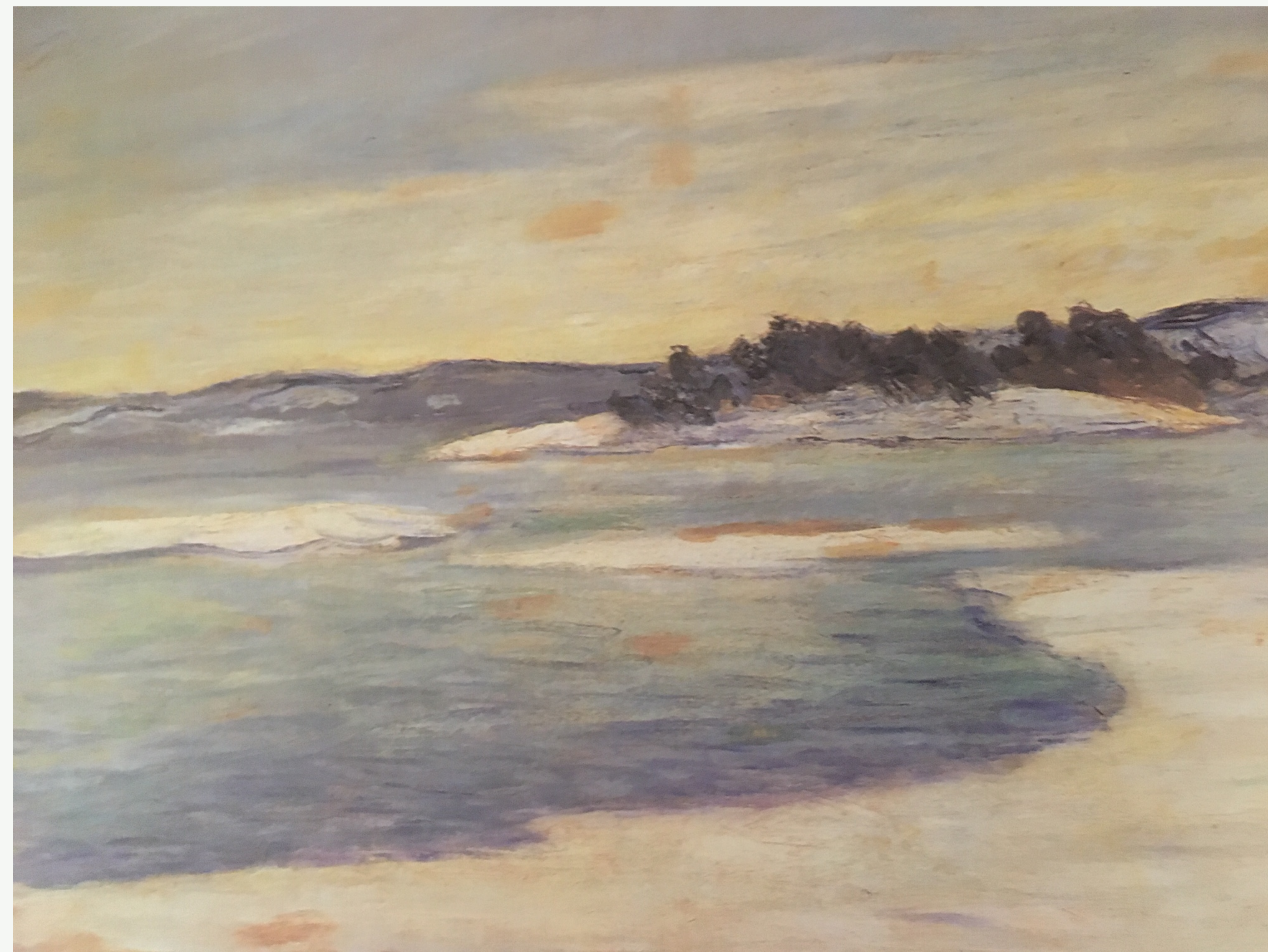
Claude Monet: Kristianiafjorden . 1895

Kråkholmen ved Ostøya. Nesodden i bakgrunnen.