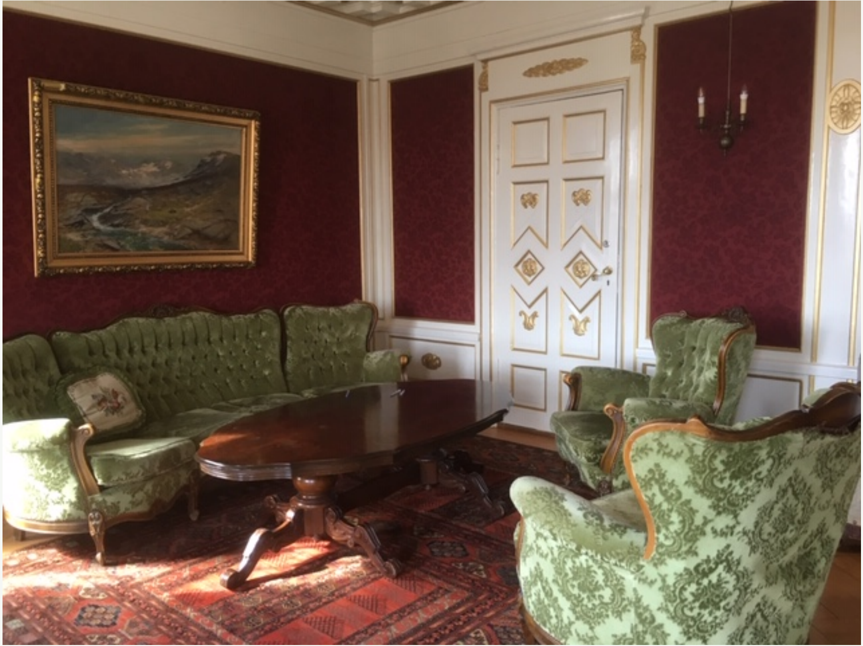
Salongen i 2. etasje