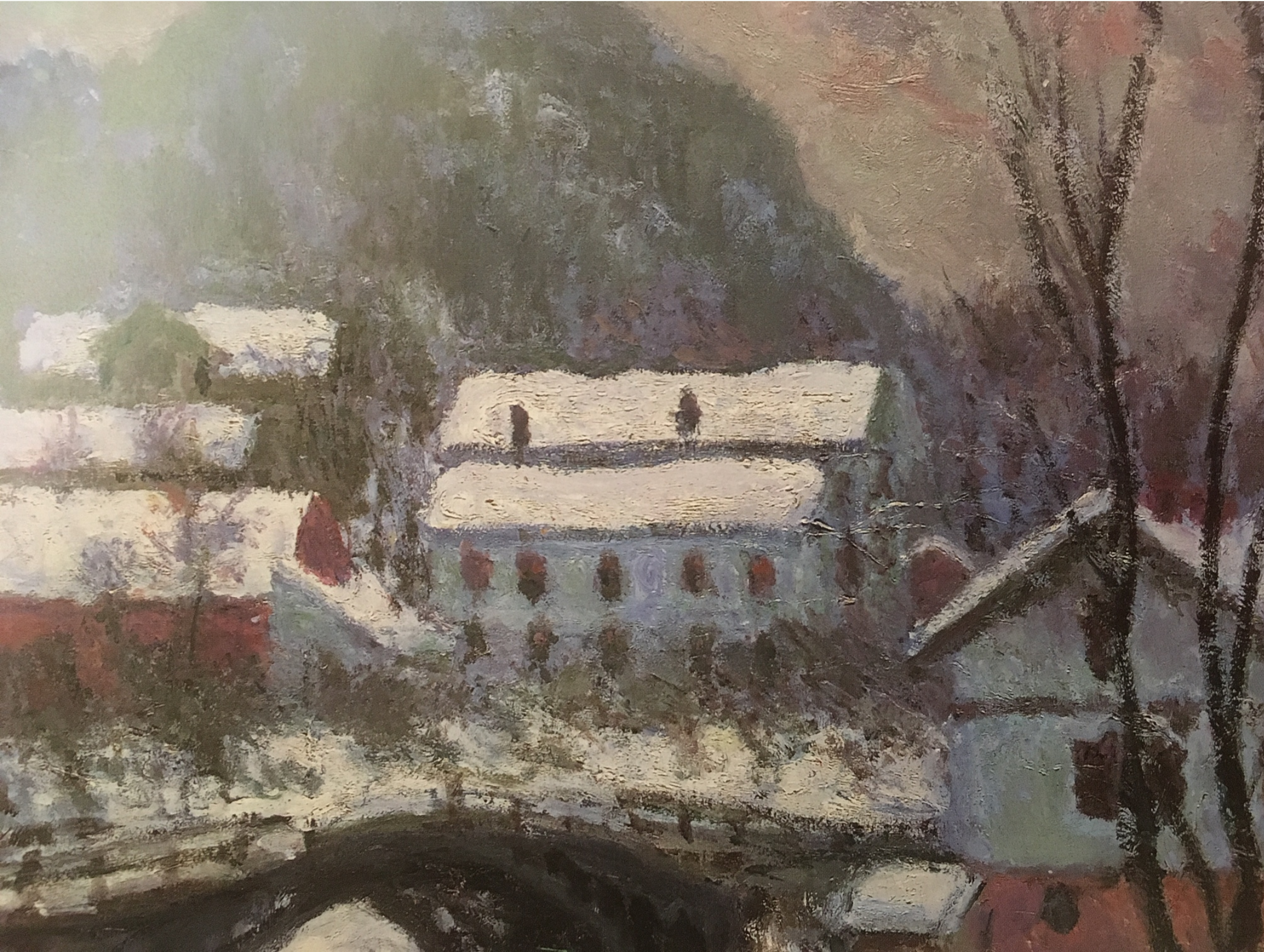
Claude Monet: Sandviken, Norge, snevirkning . 1895