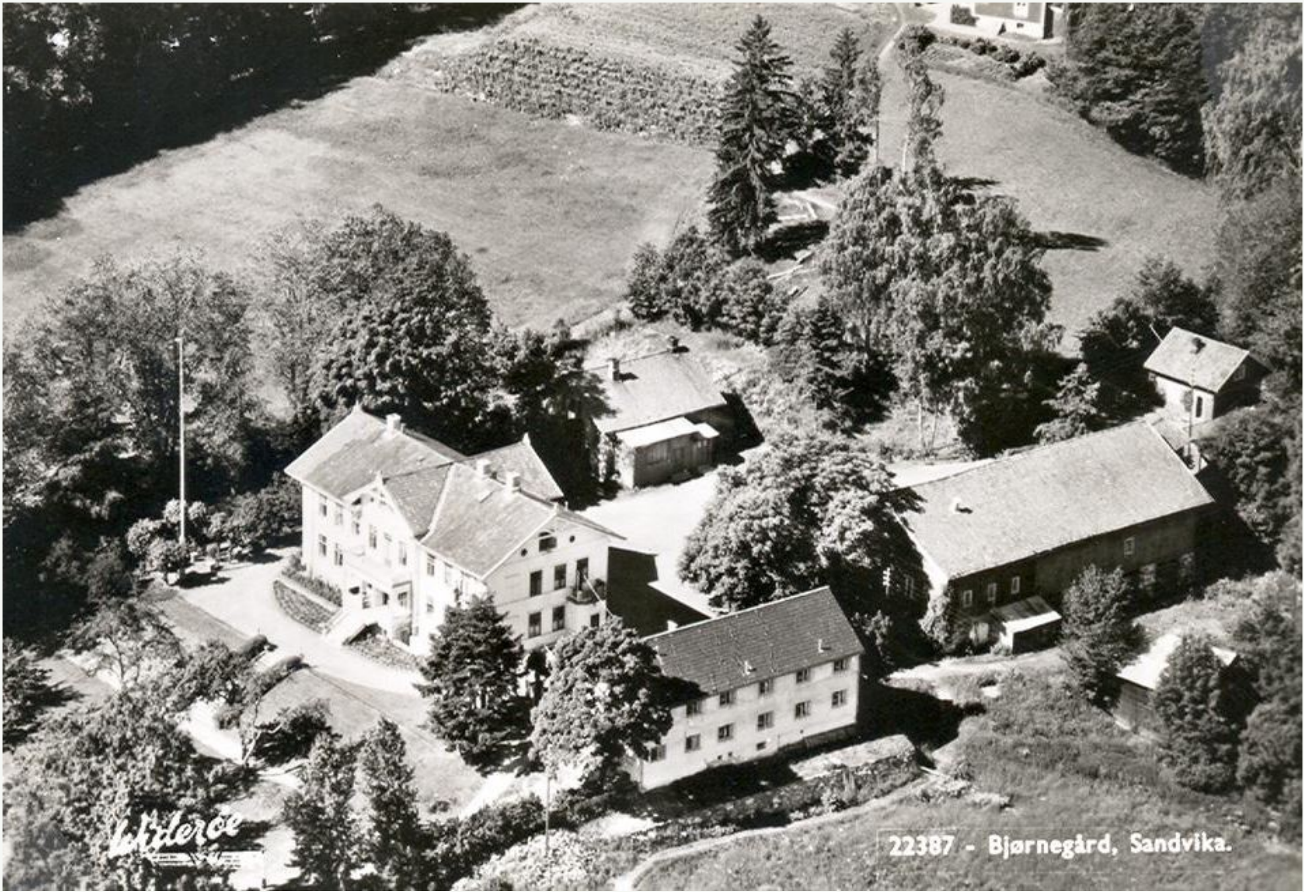
Bjørnegård, flyfoto, ca 1950