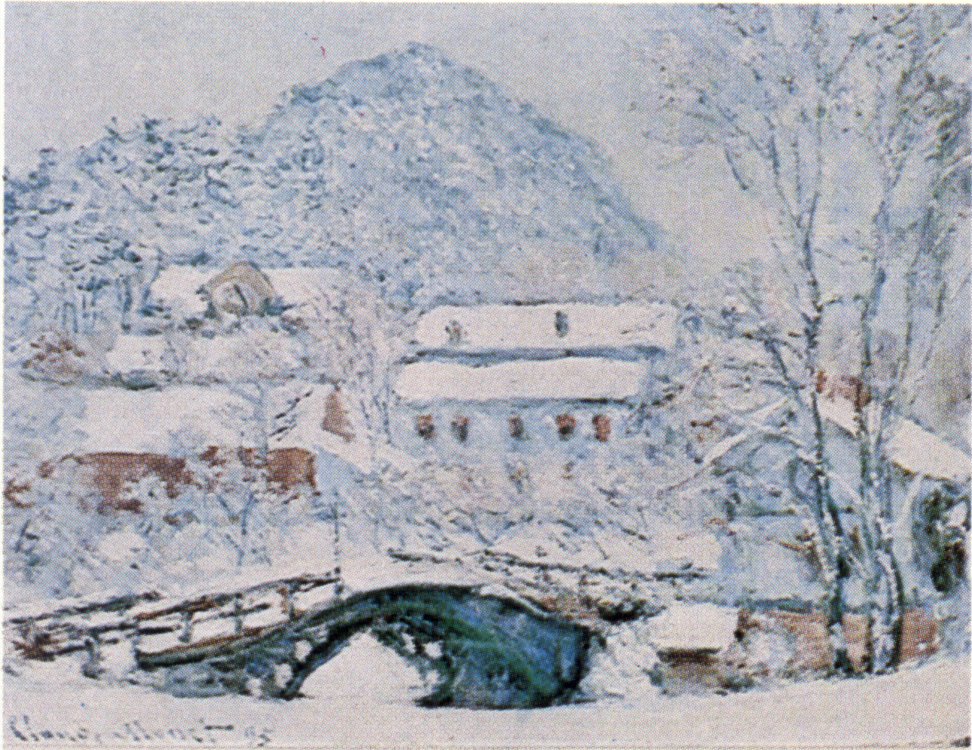
Claude Monet: Landsbyen i Sandvika i sne . 1895