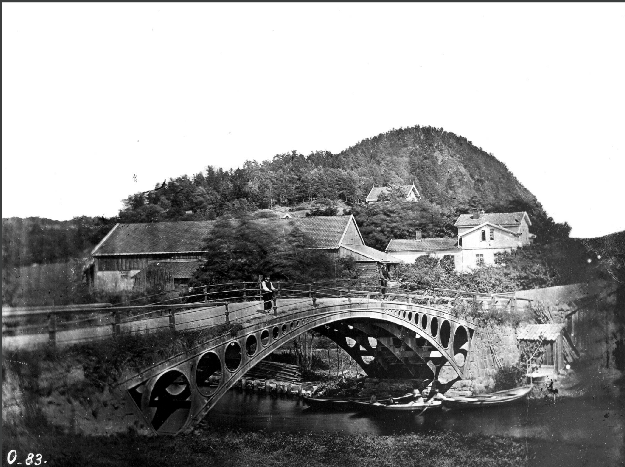
Sandvika (foto) 1883.