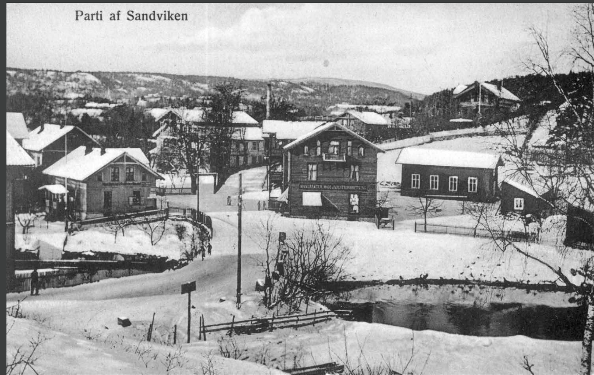
Sandvika ca 1900.